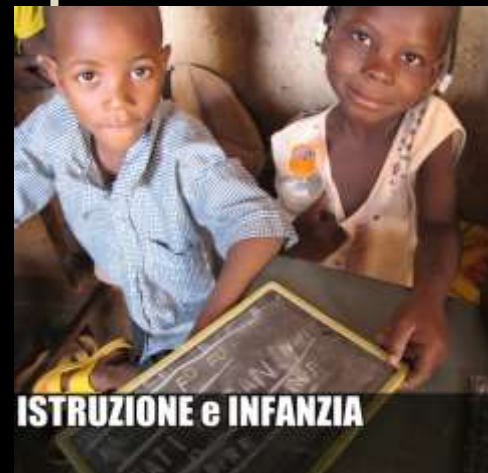
ISTRUZIONE e INFANZIA