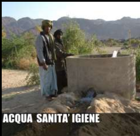
ACQUA SANITA' IGIENE